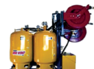
21164 V 1